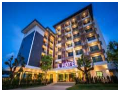
Tableau 1 : Quelques hôtels évalués entre 4 et 5 étoiles.

Principalement localisés dans la capitale économique mais surtout dans les communes dites huppées (Plateau, Cocody et Marcory) ainsi que dans les villes touristiques du pays (Grand-Bassam, Assinie, Yamoussoukro et San Pedro). Ils répondent pour la plupart aux standards internationaux et attirent majoritairement des hommes d'affaires et des touristes. Dotés d'un cadre plus intime et privé, ils offrent en plus des services de base nécessaires au bon fonctionnement de l'établissement, des services sur mesure comme la restauration, des salles de conférences modernes et bien équipées, un spa, une salle de sport, une piscine, un service de conciergerie.